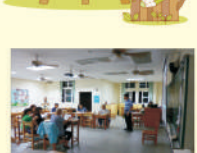
707導師、家長、學生三方歡樂交流