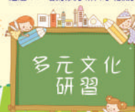
教師熱情參與，開拓教育新視野