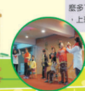
教師熱情參與，開拓教育新視野