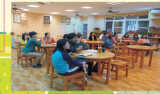
教師熱情參與，開拓教育新視野