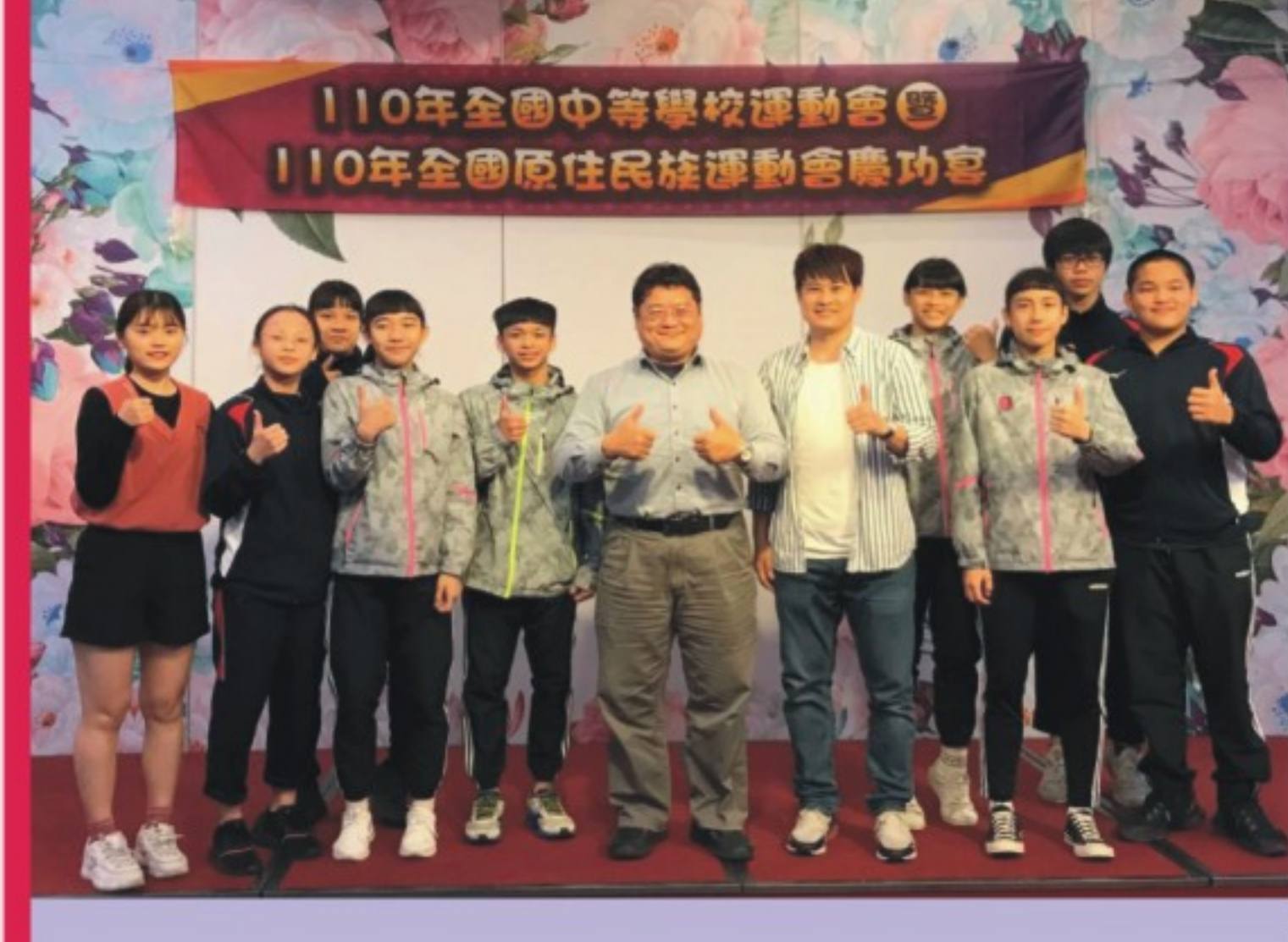
跆拳道隊 全國原住民運動會慶功