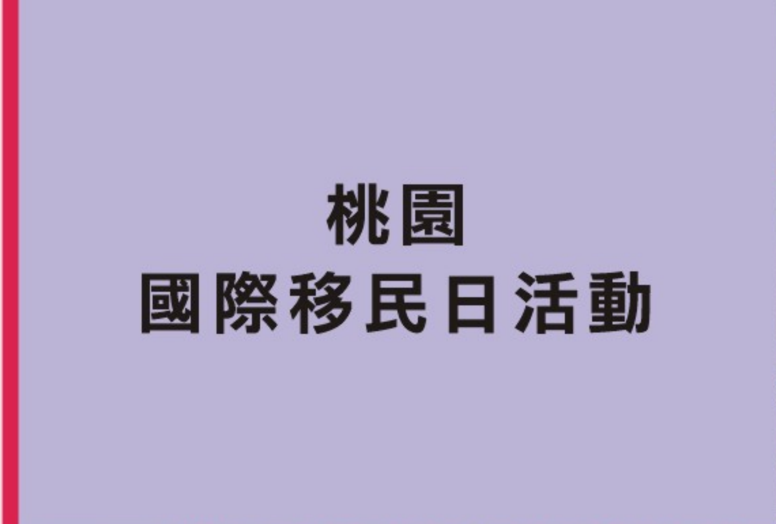
桃園 國際移民日活動