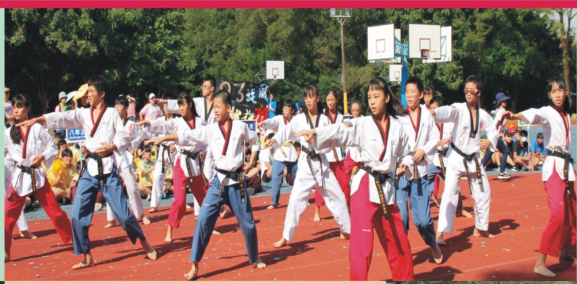
運動會- 跆拳道表演