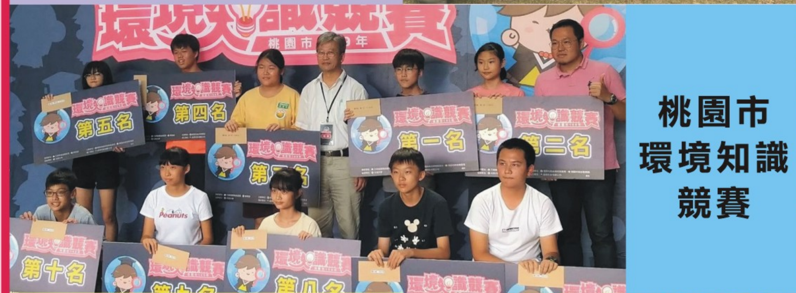
桃園市 環境知識 競賽