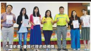
杏壇新聲-優質代理老師頒獎