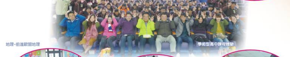
地理-前進歡迎地理