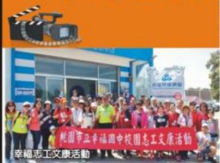
幸福志工文康活動