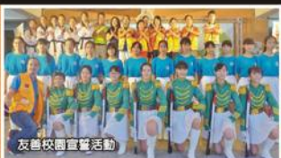
友善校園宣講活動