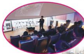
地球科學-探索星空

為幫助同學們瞭解學術型高中課程，輔導室於107年12月12日(三)下午5-7節辦理學術性高中課程體驗活動。本校與壽山高中合作，開放五個學科提供學生選擇：「歷史」、「地理」、「電腦資訊」、「公民」、「地球科學」，讓同學們對高中課程有初步認識。