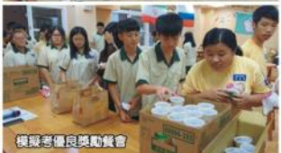
模擬考優良獎勵餐會