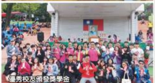
優秀校友頒發獎學金